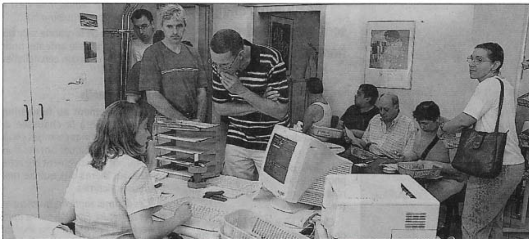
On se bousculait samedi matin dans le centre de transfusion sanguine de Mons où environ 200 poches de sang ont été remplies par des donneurs sensibilisés par la catastrophe de Ghislenghien.